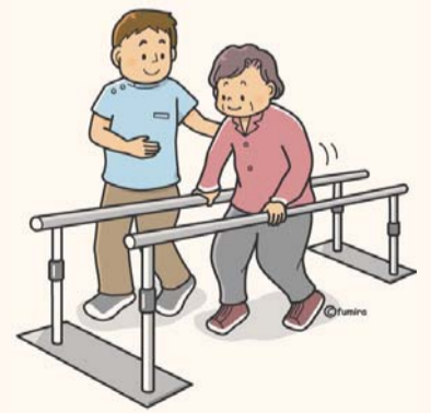
リハビリ風景（イメージ）