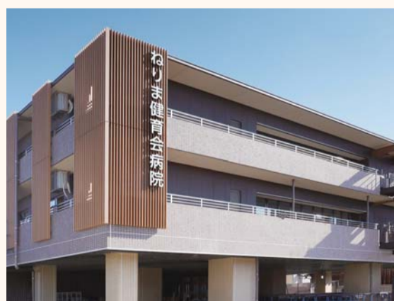
ねりま健育会病院

本年4月、区内2か所目のリハビリテーション病院となる「ねりま健育会病院」（100床）が開院。新たに、高野台運動場跡地にも回復期リハビリテーション病院を誘致してまいります。また、順天堂練馬病院を増床（90床）・3次救急医療病院として医療機能を拡充します。