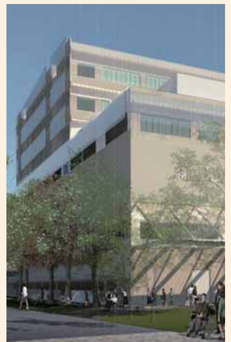
新練馬光が丘病院(イメージ)